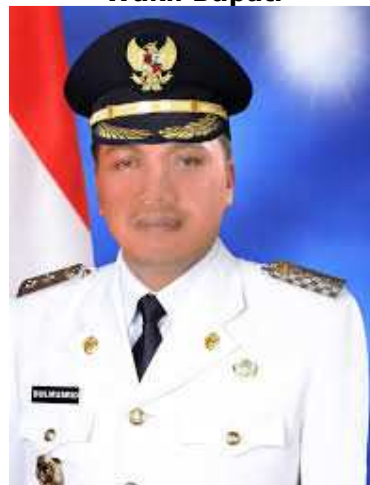
DULMUSRID (2012 - 2017)